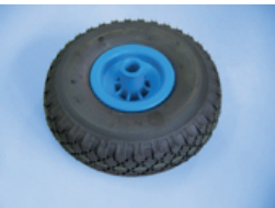
Luftrad Ø 260 mm

Art.-Nr.: 0116.00.208.101 Eigengewicht: 18,5 kg Tragkraft: bis 400 kg