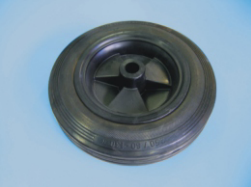
Vollgummirad Ø 200 mm

Art.-Nr.: 0116.00.208.101 Eigengewicht: 18,5 kg Tragkraft: bis 400 kg